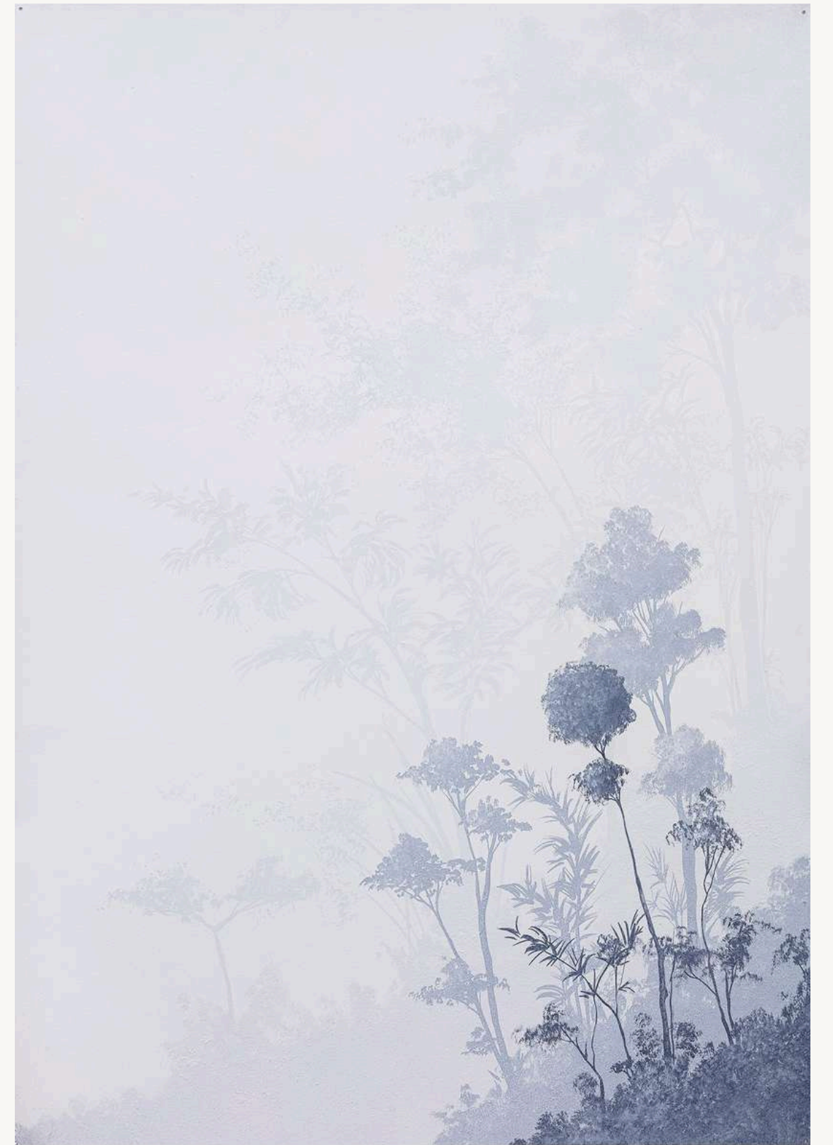
Longe II , 2023 Pintura Acrilica sobre papel 87 x 58 cm