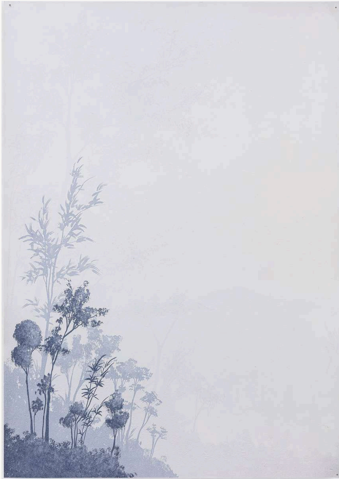
Longe I , 2023