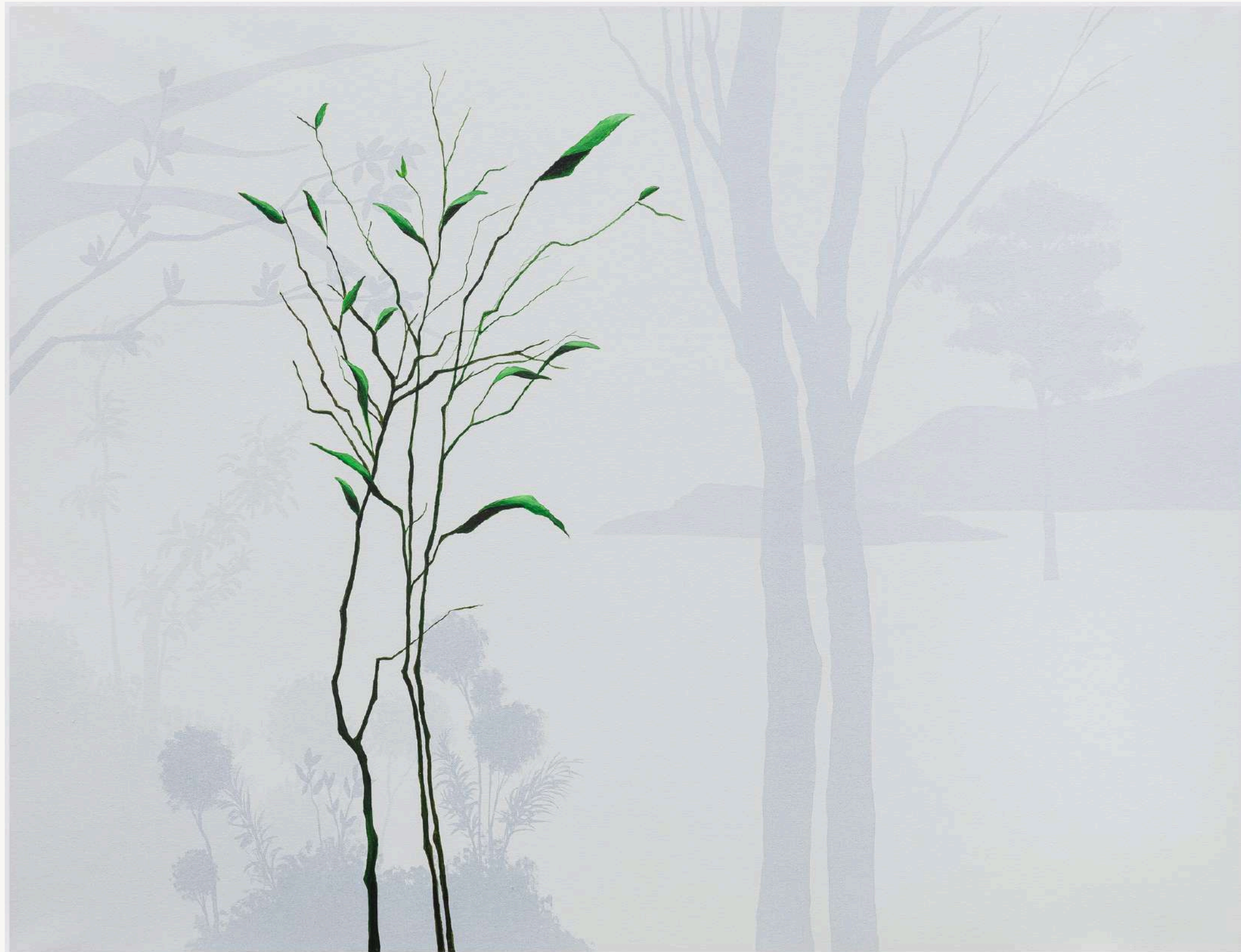
SILÊNCIO 1 , 2023 Acrilica sobre tela 65 x 85 cm