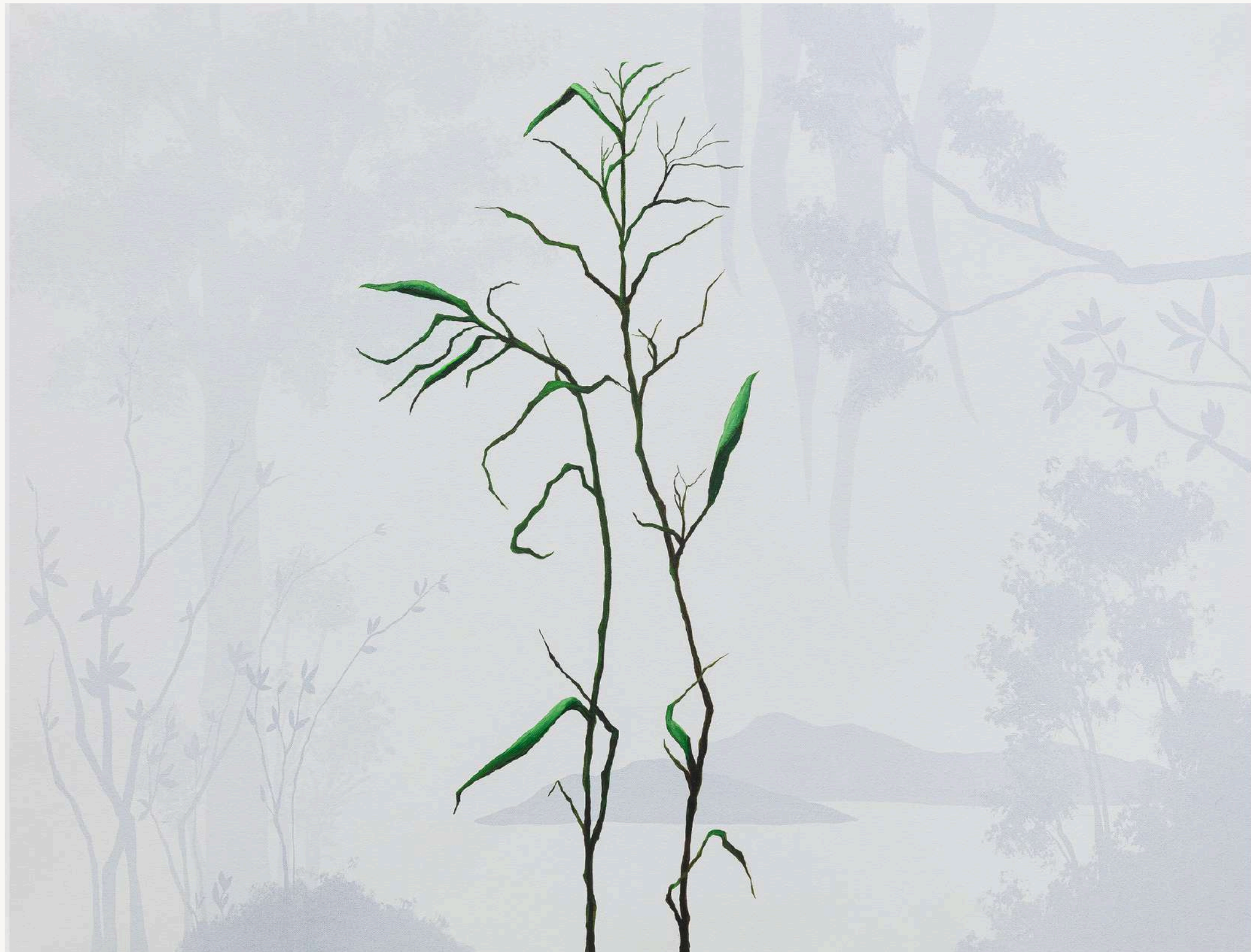
SILÊNCIO 3 , 2023 Acrilica sobre tela 65 x 85 cm