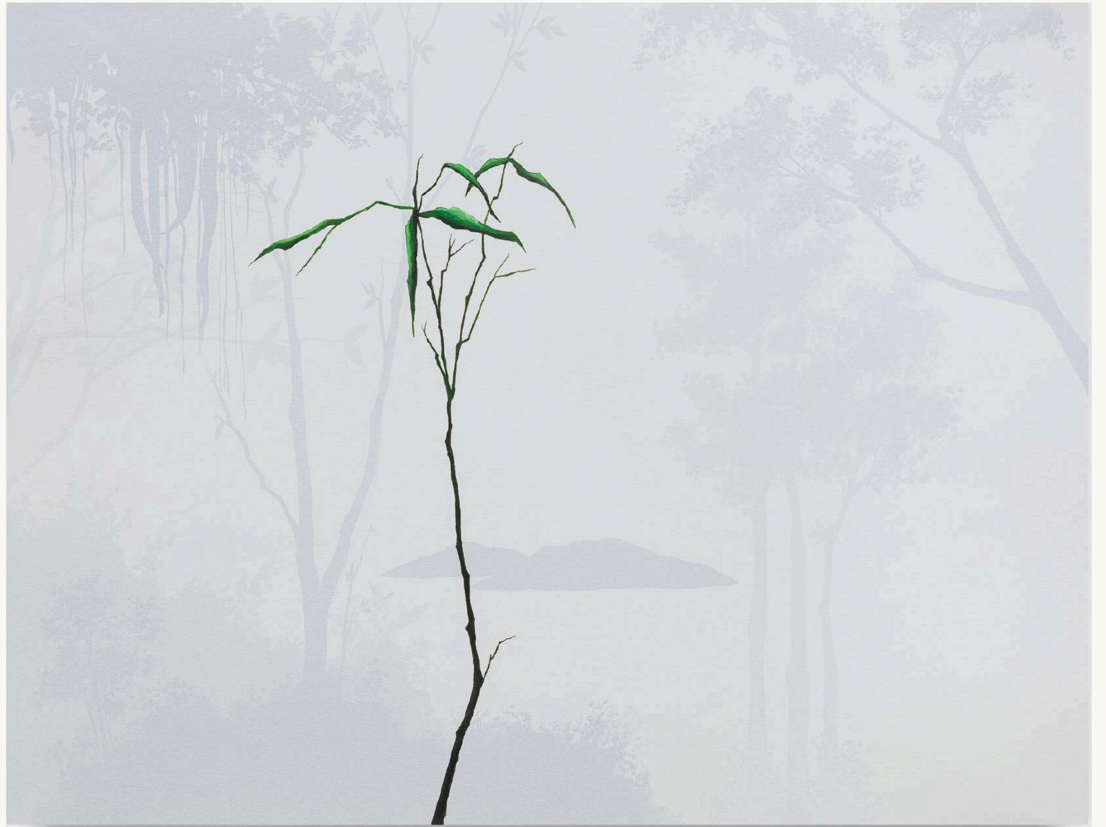
SILÊNCIO 2 , 2023 Acrilica sobre tela 65 x 85 cm