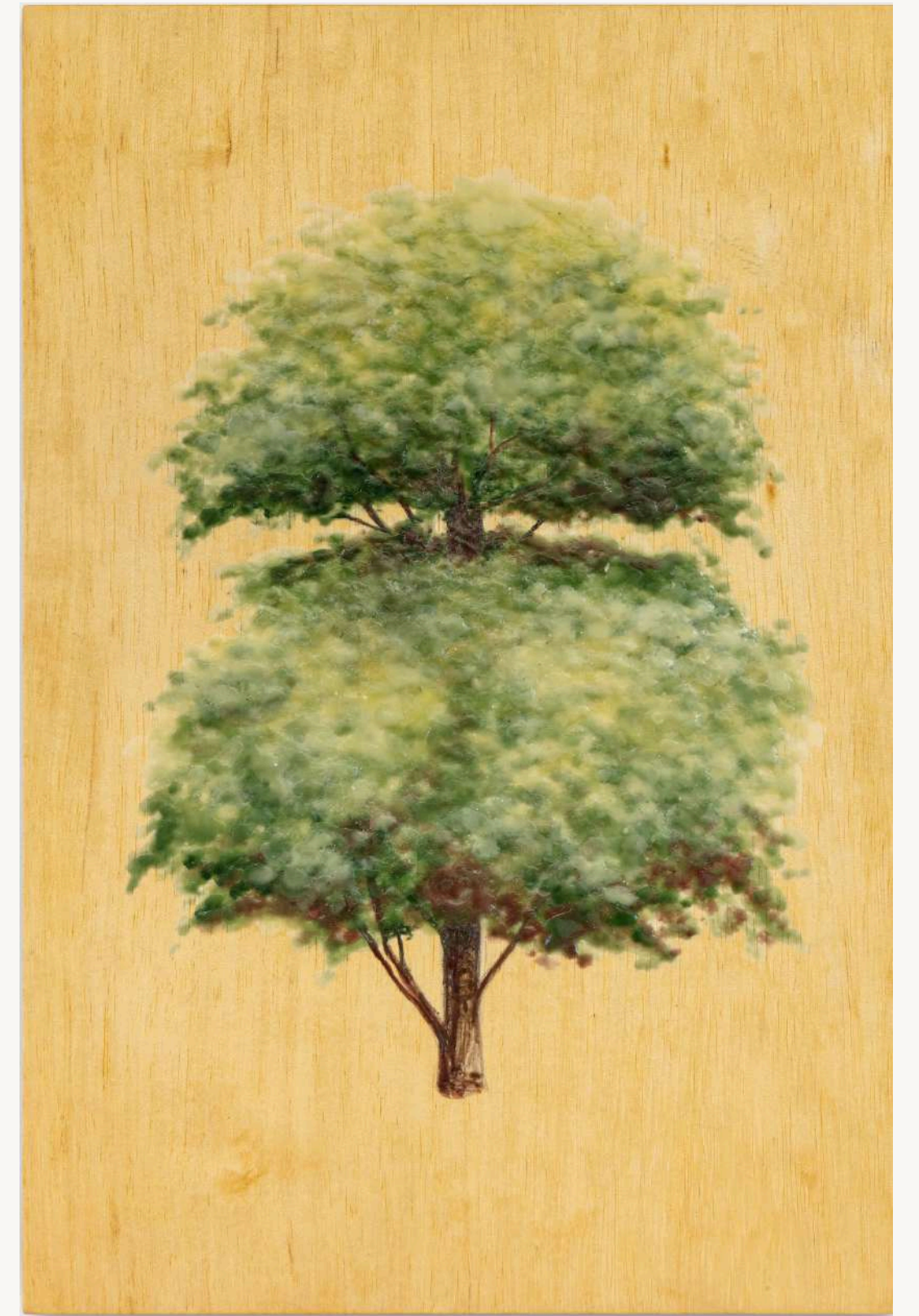
Árvore III , 2023 Encáustica sobre madeira caxeta 41 x 27 x 3 cm