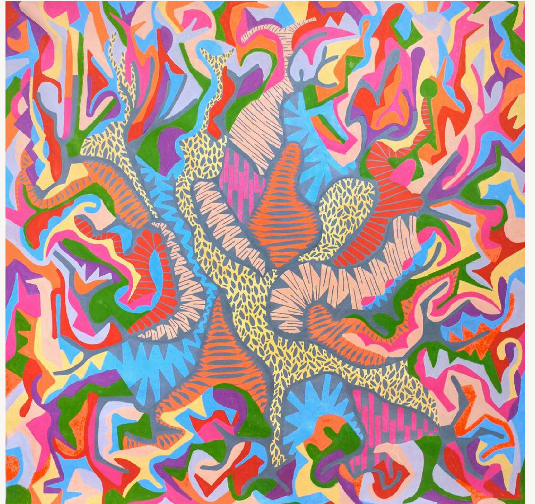
Sulco I , 2020 Acrílica sobre tela 200 x 200 cm