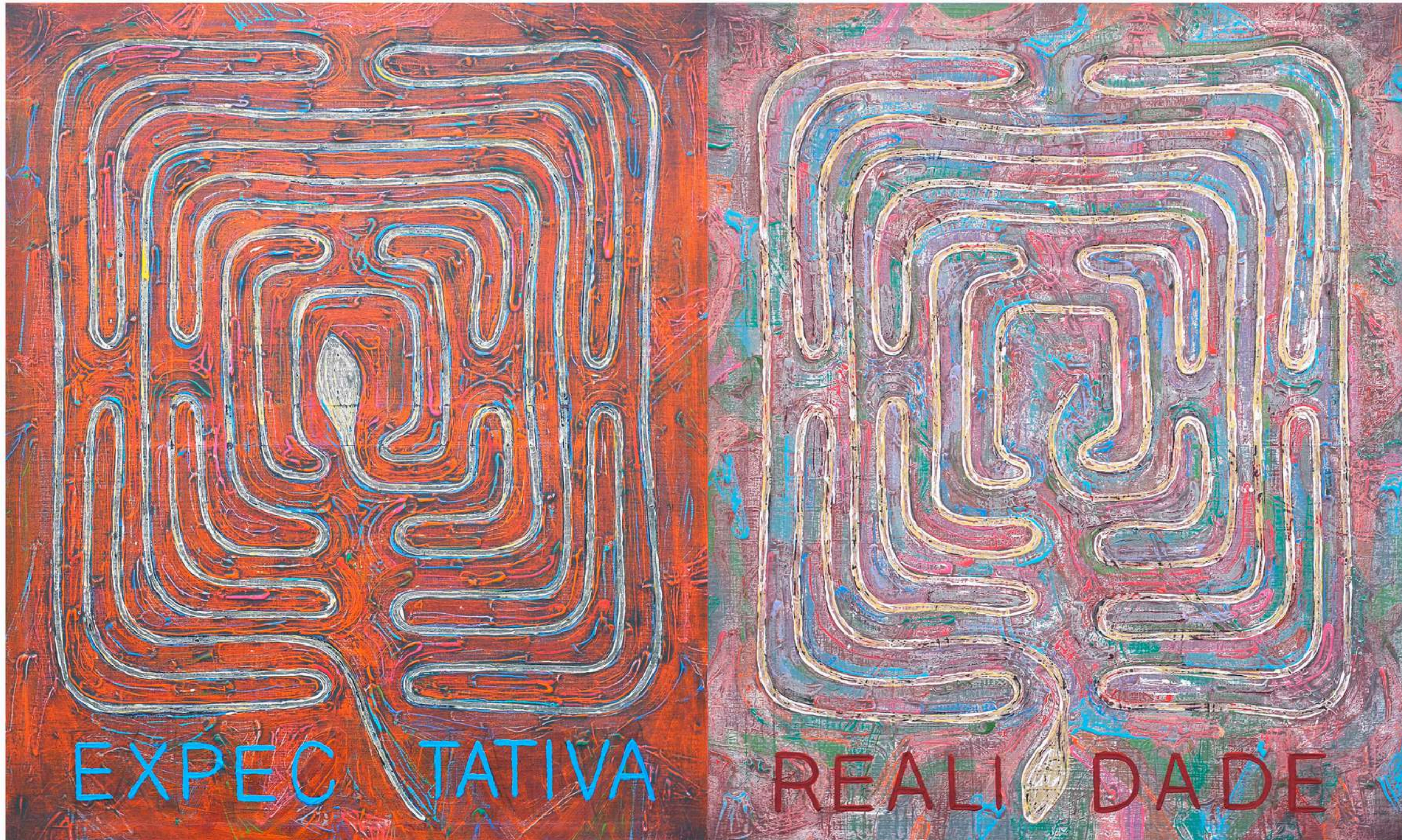
Meme , 2023 Acrílica sobre tela 60 x 50 cm cada