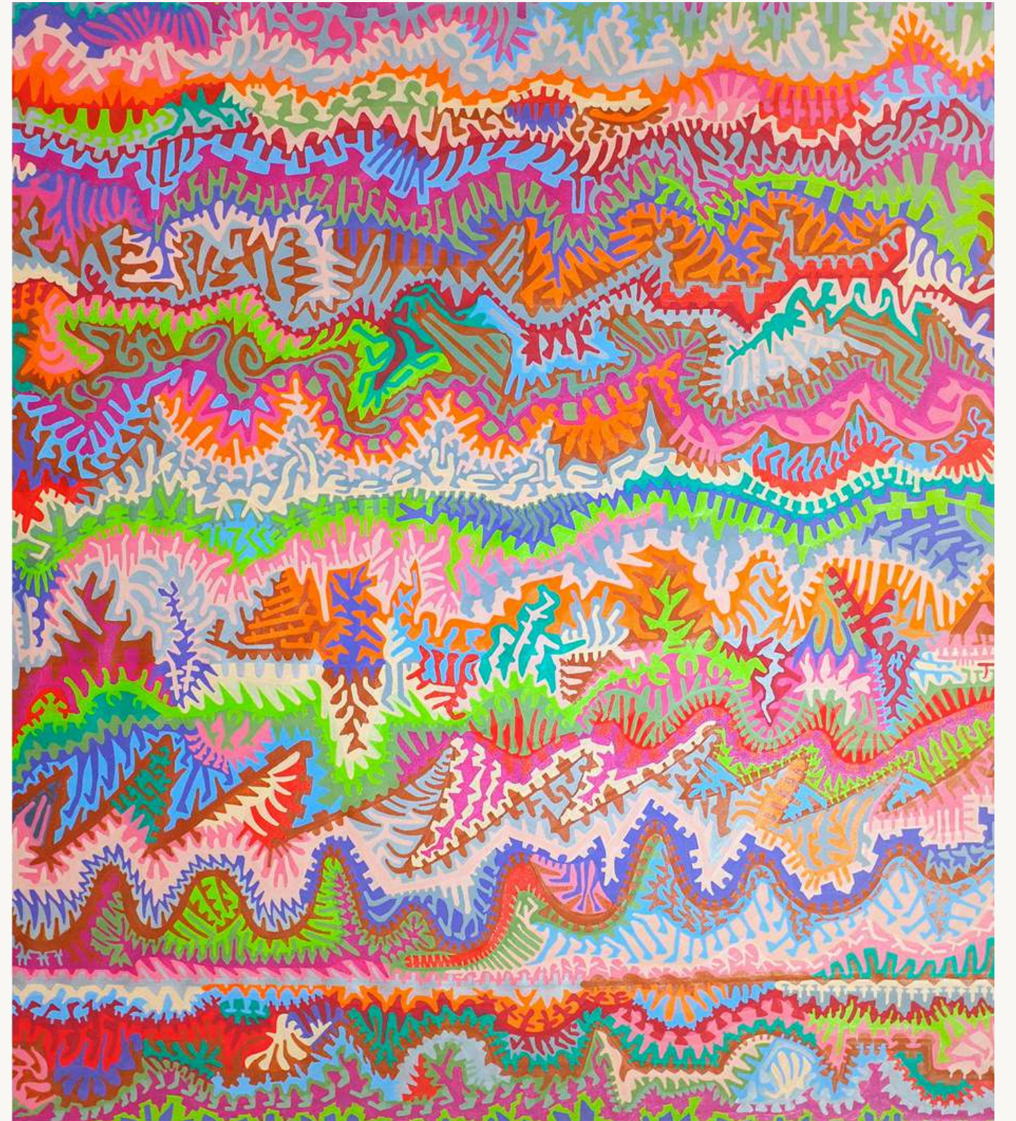
Sulco II , 2020 Acrílica sobre tela 185 x 162 cm cada