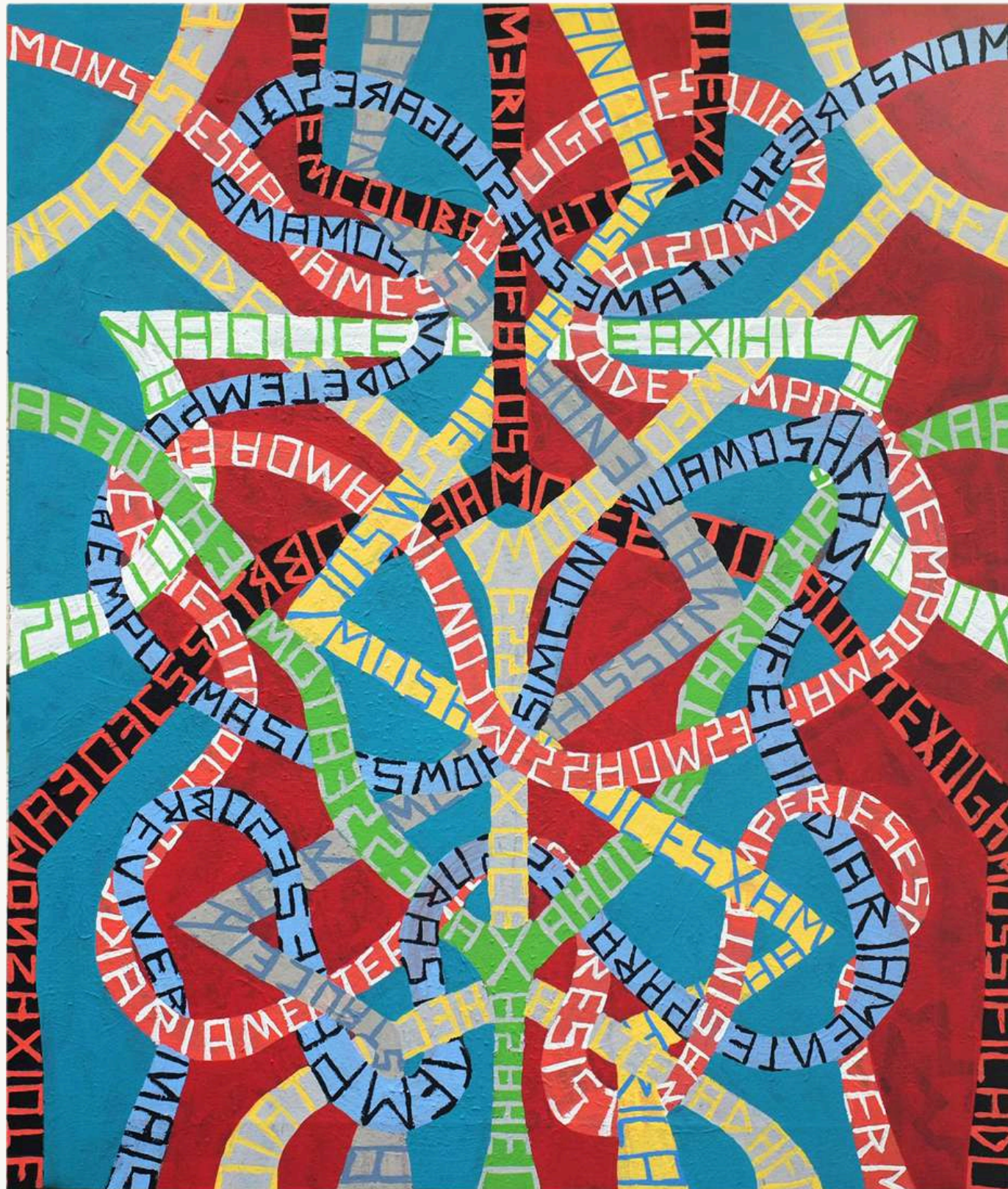
Onomatopéia 1 , 2023 Tinta acrílica sobre tela 85 x 72 cm