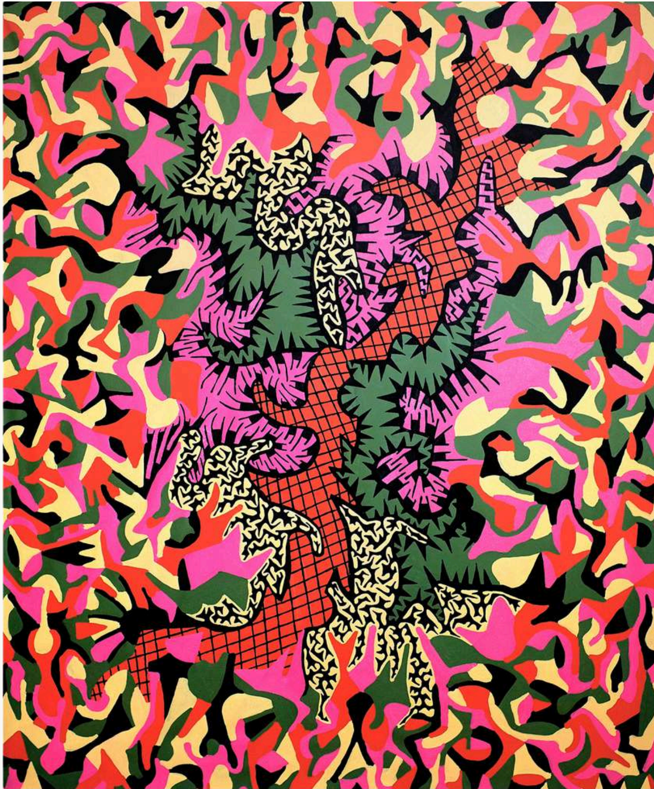
Talho (5cores) , 2020 Acrílica sobre tela 205 x 170 cm cada