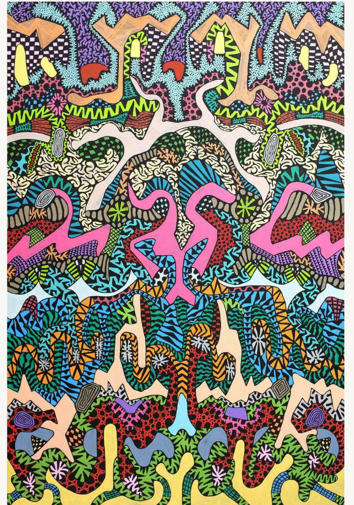
Simetria mole , 2024 Acrílica sobre tela 150 x 100 cm