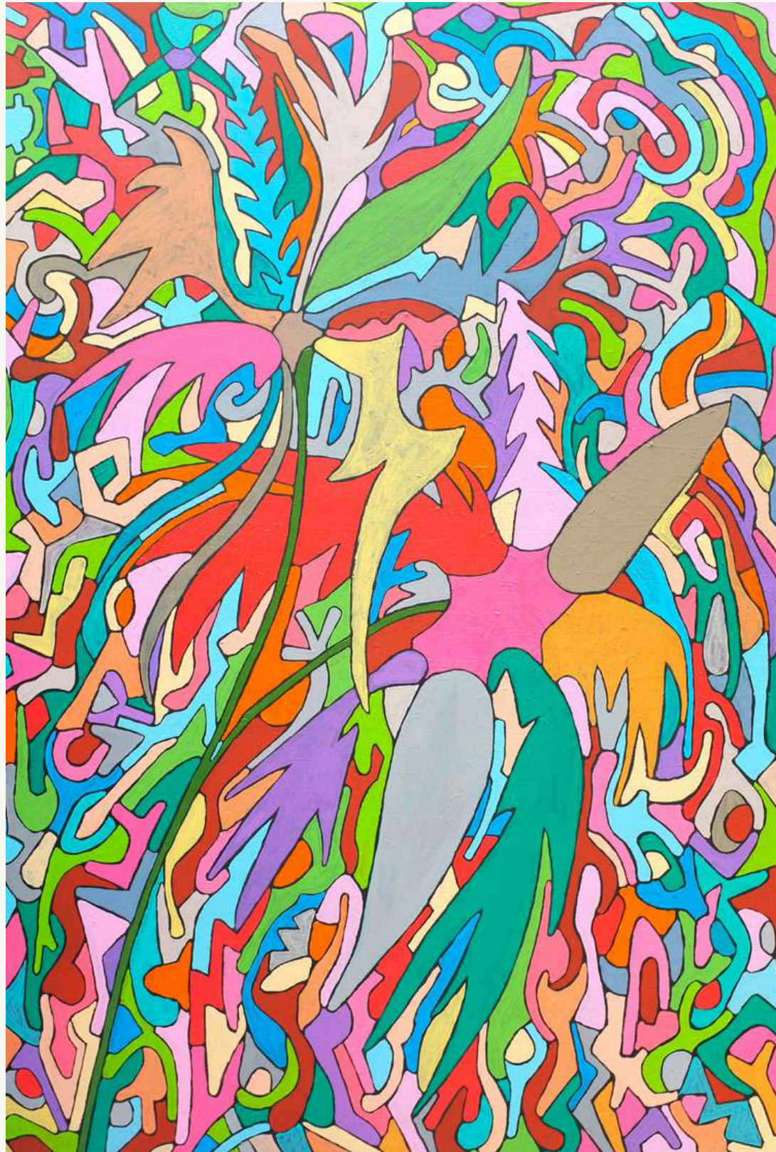
Figurafundo I , 2024 Acrílica sobre tela 150 x 100 cm