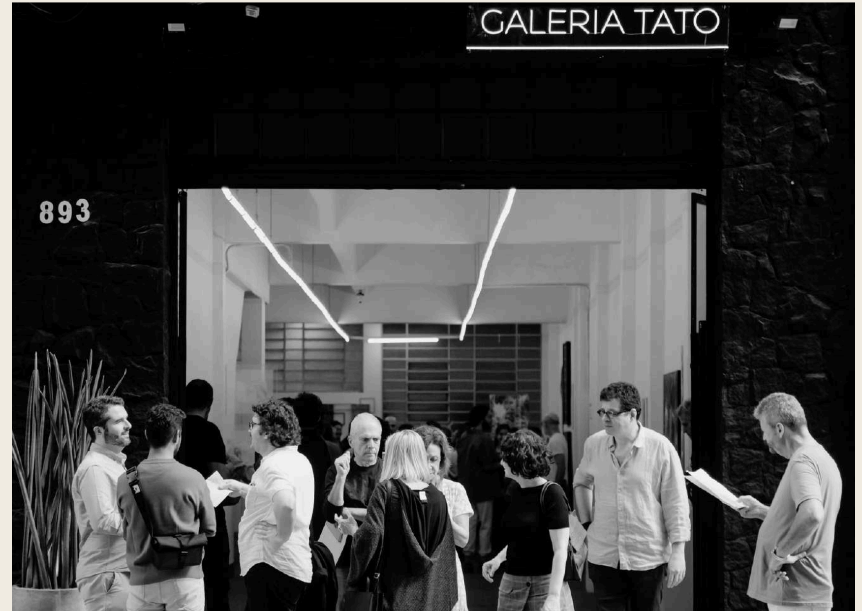
Abertura das exposições Além da Foz e Grau Zero (Casa Tato 7 e Casa Tato 8)

Os profissionais convidados falarão sobre como funciona o Mercado, suas possibilidades de atuação e como trabalhar para chegar até as Galerias e Feiras de Arte .