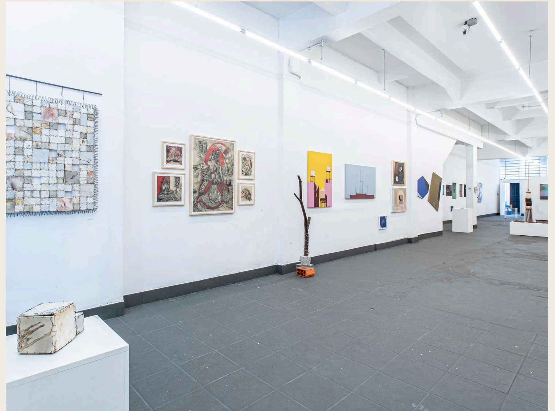
Exposição O que dizer de nós? (Casa Tato 9, Casa Tato 10).